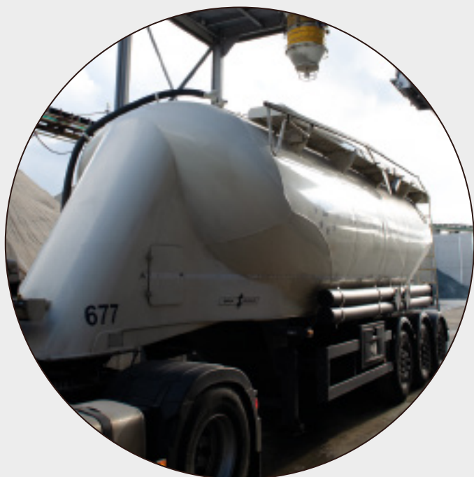
BULKWAGEN VOOR HET VULLEN SILO'S